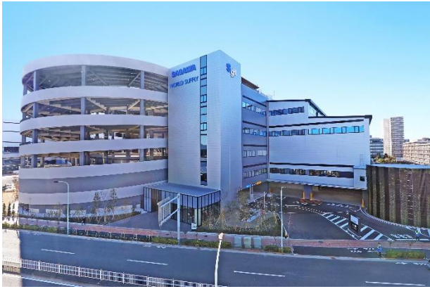
新社屋となる SG リアルティ新砂