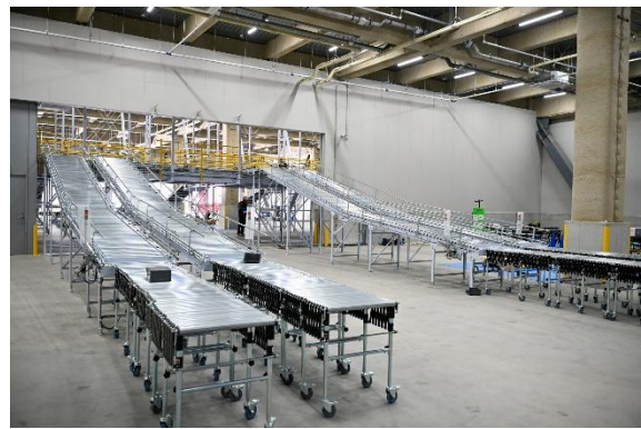
新拠点内観。最新の設備を活用し、品質を維持しつつ効率化を図る

当社は今後も、流通ソリューションパートナーとしてグループの総合力を生かしてお客さまの多様な課題に寄り添い、持続可能なビジネスの発展に貢献します。